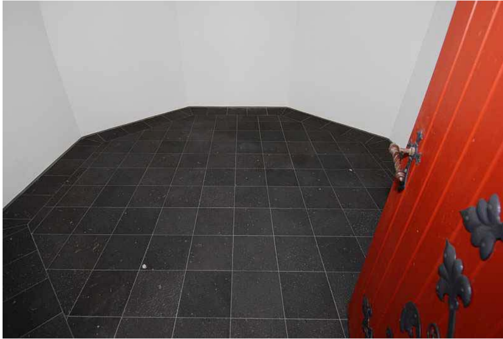
Abb. 12 Bodenplatten aus Basalt

An den Sanierungsarbeiten waren folgende Firmen beteiligt: