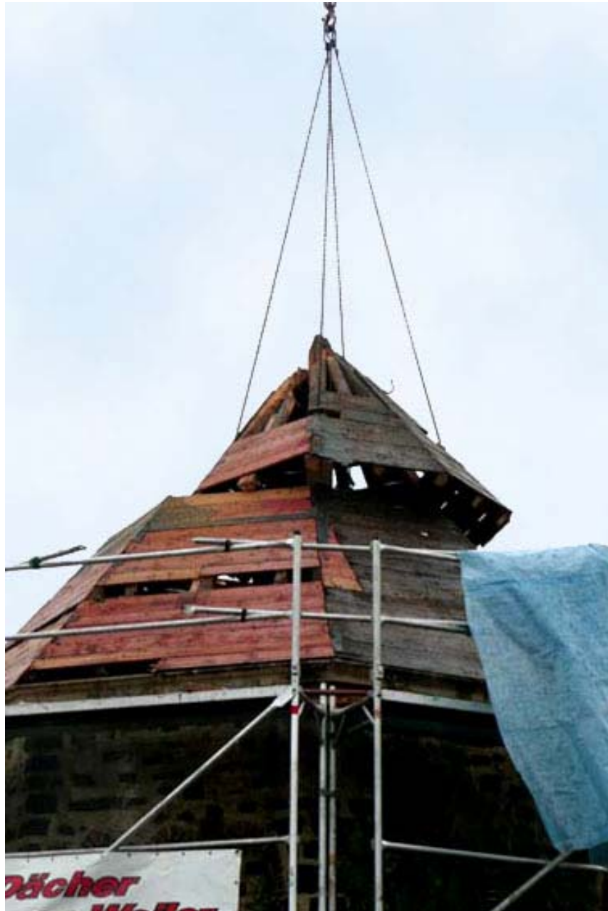
Abb. 11 Abbau des desolaten Dachstuhls

Gleich nach Aufstellen des Baugerüsts zeigte sich jedoch, dass der Dachstuhl völlig desolat war. Wespennester befanden sich im Dachgebälk, die Balken selbst waren völlig zerfressen. Auch auf Anraten des Denkmalpflegers Dr. Georg Peter Karn musste die vollständige Erneuerung des gesamten Dachstuhls in Angriff genommen werden. Dies bedeutete einen weiteren sehr großen finanziellen Aufwand, der nur mit weiteren Spenden und durch zusätzliche Fördermittel des Landesdenkmalamtes bewältigt werden konnte.