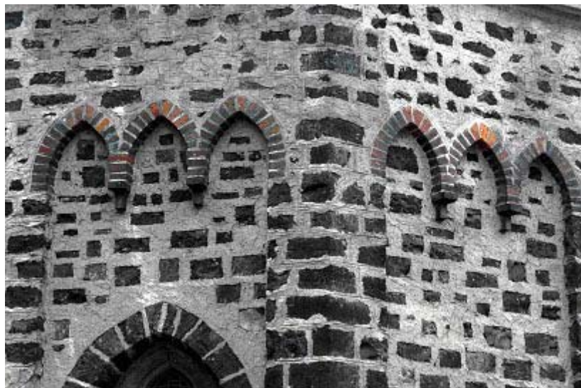
Abb. 6 Detailaufnahmen: Pilaster und Fläche mit Spitzbögen

Das Äußere der Kapelle wurde zur Erbauungszeit mit verschiedenen Baumaterialien und Techniken gestaltet. Schwarz-roter Schlacketuff bildet das Mauerwerk. Die Spitzbögen zwischen den vorgelagerten Eckpilastern sind aus Ziegelsteinen (Abb. 6) gemauert. Die breiten Kalkmörtelfugen im Bereich der Pilaster und der Flächen oberhalb der Spitzbögen sind mit einem Fugeisen nachgezogen und mit weißer Farbe betont. In den Wandflächen unterhalb der Spitzbögen wurden einzelne Steine als rechteckige Quader aus dem Mörtel freigestellt.