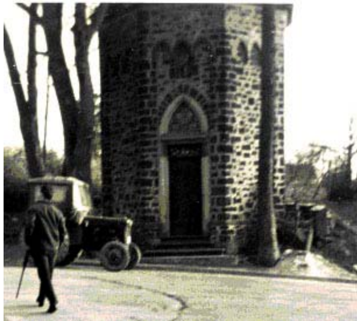
Abb. 1, 2 „Mit zwei Männern (um 1920)" / "Mit Gewehrträger (1950er)“

Auf der Abbildung um 1920 lässt sich am Dach eine andere Deckungsart, nämlich ein Spitzwinkelschablonendach („Ort am Grat“) 5 nachvollziehen.