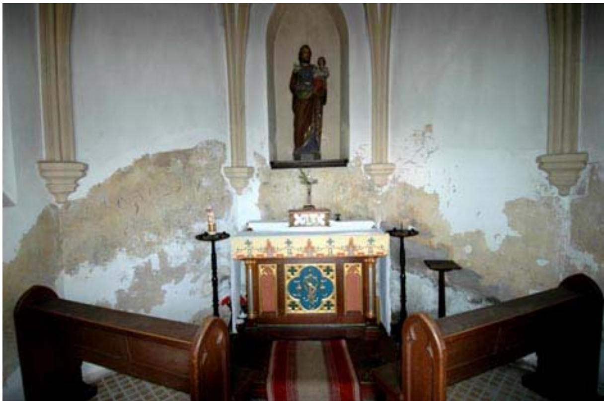
Abb. 9 Schäden am Innenputz

Sowohl das Landesamt für Denkmalpflege, mit insgesamt 10 000 €, als auch die beiden ortsansässigen Kreditinstitute Raiffeisenbank und Kreissparkasse haben mit je 1000 € die Arbeiten unterstützt. Weitere 1000 € sagte 2007 der damalige Stadtbürgermeister Maximilian Mumm zu. Die letzten 40 Jahre hatten an der Kapelle einige Schäden hinterlassen ( siehe Zustands- und Maßnahmenbeschreibung vom Mai 2007 ) 9