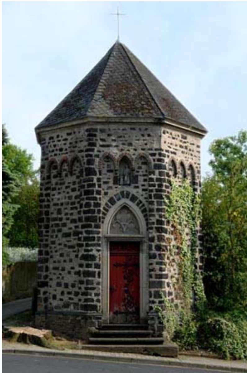
Abb. 3 Gesamtaufnahme Zustand 2006

Als Bauherr der Münsterer Kapelle muss die Stadt Münstermaifeld angenommen werden. Warum aber sie dem Hl. Josef geweiht wurde, ist nicht bekannt, sind doch beim ehemaligen St. Josef-Hospital sowohl die hauseigene Kapelle wie auch die kleine Kapelle im Garten diesem Heiligen gewidmet. Ob die Finanzierung alleine durch die Stadt erfolgte, ist zweifelhaft, denn zur möglichen Bauzeit war der Kulturkampf im Rheinland noch in vollem Gange. Dieser gesellschaftspolitische Umstand lässt vermuten, dass aus diesem Grund keinerlei Meldungen über das Vorhaben "St. Josef-Kapelle", nicht einmal in den einschlägigen Zeitungen, erhalten sind.