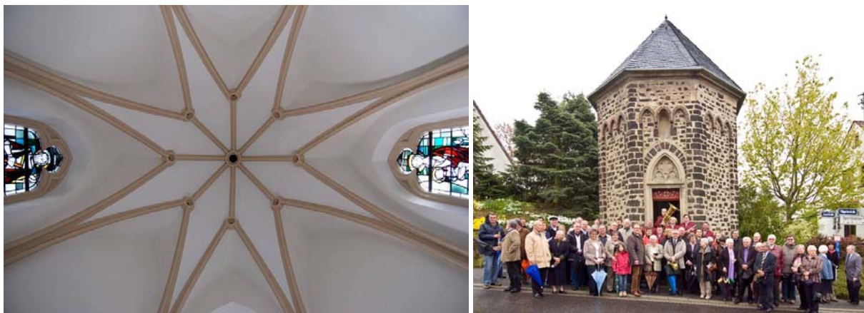
Abb. 13, 14 Blick ins renovierte Gewölbe / Feierstunde am 9. Mai 2010

Am 9. Mai 2010 wurde die Kapelle in einer öffentlichen Feierstunde von Pfarrer Guido Lacher eingeweiht.