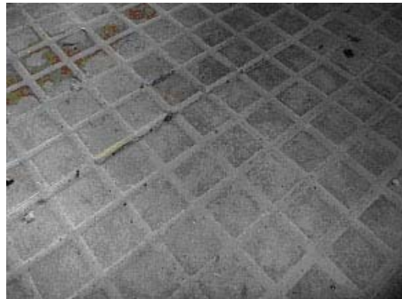
Abb. 4, 5 Detailaufnahmen: Terracottafliesen (19. Jh.) / neuzeitliche „Riffelplatten“

Das Äußere der Kapelle wurde zur Erbauungszeit mit verschiedenen Baumaterialien und Techniken gestaltet. Schwarz-roter Schlacketuff bildet das Mauerwerk. Die Spitzbögen zwischen den vorgelagerten Eckpilastern sind aus Ziegelsteinen (Abb. 6) gemauert. Die breiten Kalkmörtelfugen im Bereich der Pilaster und der Flächen oberhalb der Spitzbögen sind mit einem Fugeisen nachgezogen und mit weißer Farbe betont. In den Wandflächen unterhalb der Spitzbögen wurden einzelne Steine als rechteckige Quader aus dem Mörtel freigestellt.