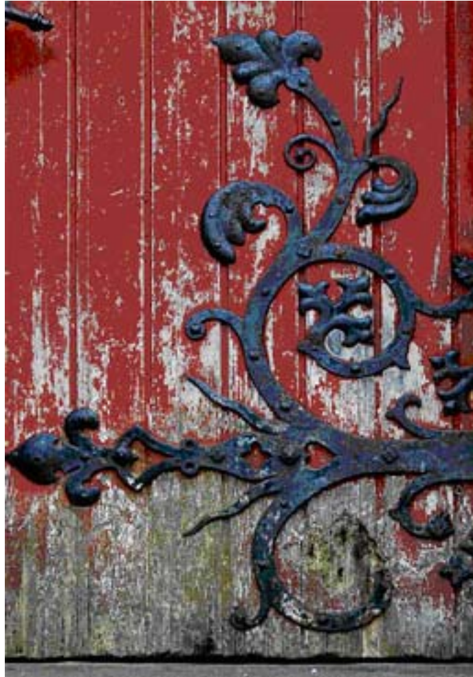
Abb. 10 Schäden an der Tür, Detail

Ursache für die Schäden war das Zuschütten des die Kapelle umgebenden Grabens. Dadurch konnte Feuchtigkeit ungehindert ins Mauerwerk eindringen. Zudem hatte die Kapelle keine Dachrinne.