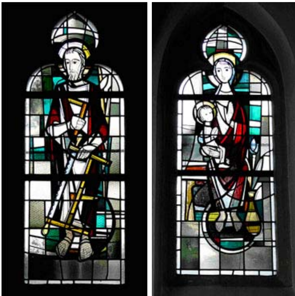
Abb. 7, 8 Glasmalerei: Josef und Maria mit Kind (1965)

Auch zu den Baumaßnahmen Mitte der 1960-ziger Jahre finden sich keine Belege. Offensichtlich wurde in dieser Zeit das Dach erneuert, einschließlich des Dachstuhls, der Boden mit Fliesen neu belegt, die Glasfenster erneuert und der Innenraum neu gestrichen. Wer diese Arbeiten veranlasst und wer sie gezahlt hat, ist unbekannt.